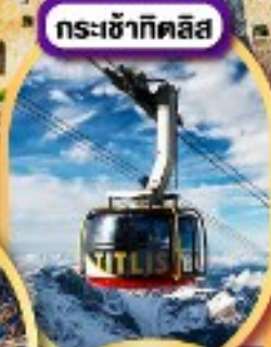
กระเช้ากิตลิส