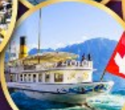
ส่องเรือทะเลสาบเจนีวา