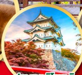
ปราสาทอิโรซากิ