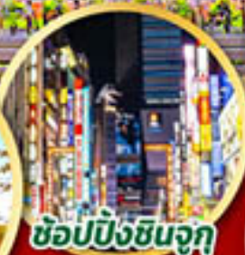
ซ้อปั้งชินจุกุ