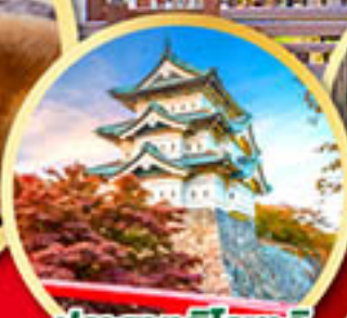
ปราสาทอิโรฮาเกะ