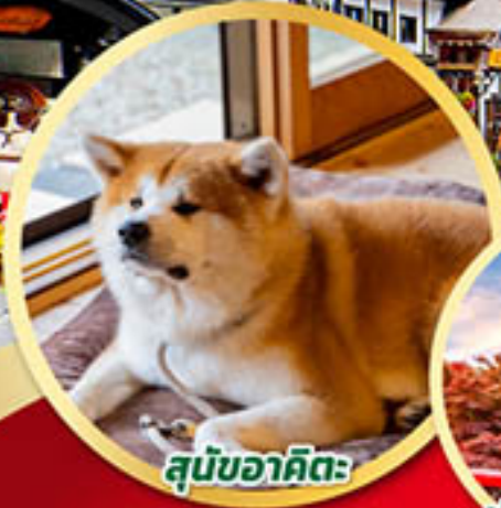
สุนัขอาคิตะ