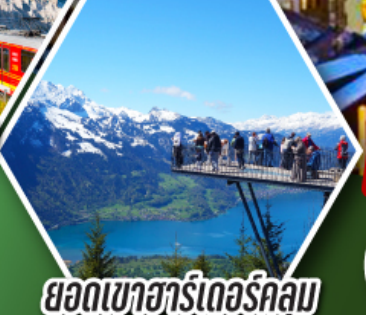
ยอดเขาอาร์เดอร์กุลม

พักเมืองเซอร์แมท เมืองตากอากาศระดับโลก ที่มีฉากหลังเป็นยอดเขามัตเตอร์ฮอร์น ราคาเริ่มต้น