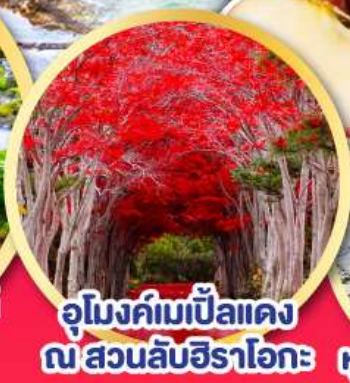
อุโมงค์ไม้แป้นแดง ณ สวนลับฮิราโอกะ