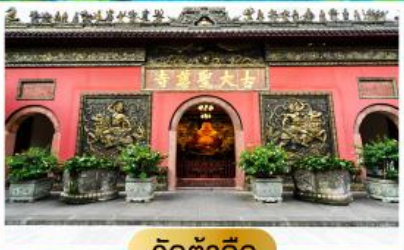
วัดต้าฉือ