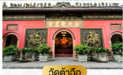
วัดต้าอ้อ