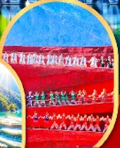
โชว์ Impression Lijiang