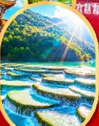
หุบเขาสีน้ำเงิน