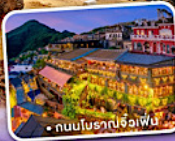
• ถนนโบราณจิวเฟิน