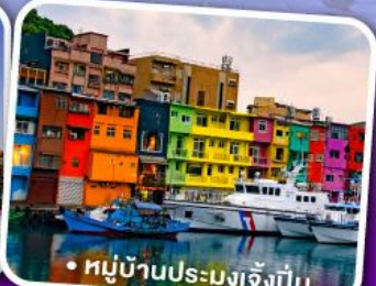
• หมู่บ้านประมงเจิ้งปิ่น