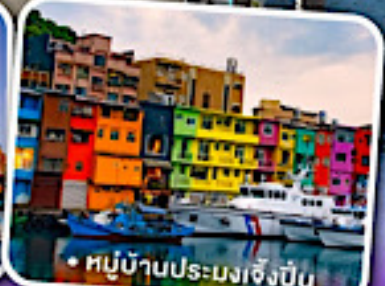
• หมู่บ้านประมงเจิ้งปิ่น