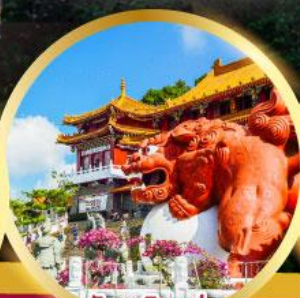
วัดเหวินหวั่น