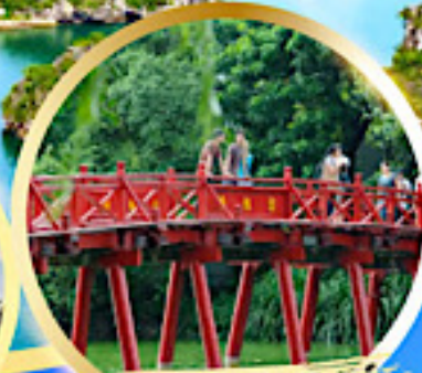
สะพานแสงอาทิตย์