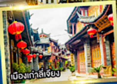
เมืองเก๋าลี่เจียง