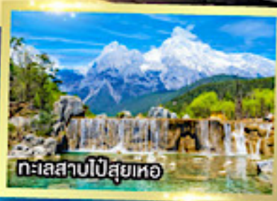
ทะเลสาบไป๋สือเหอ