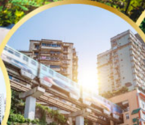
รถไฟฟ้าทะลุติ๊ก หลุมฟ้าสะพานสวรรค์