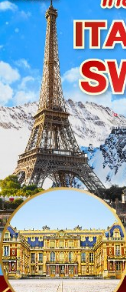
พระราชวังแวร์ซาย