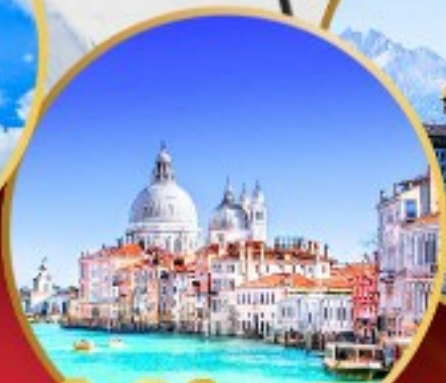
ล่องเรือสู่เกาะเวนิส