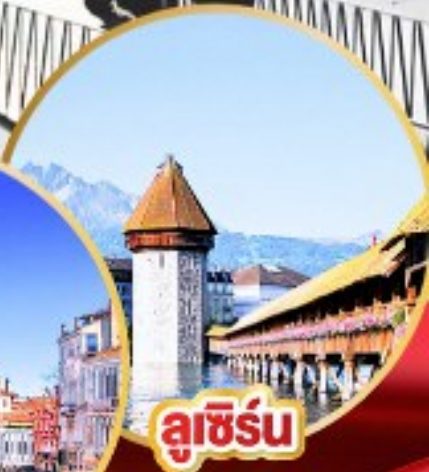
ลูซิิร์น