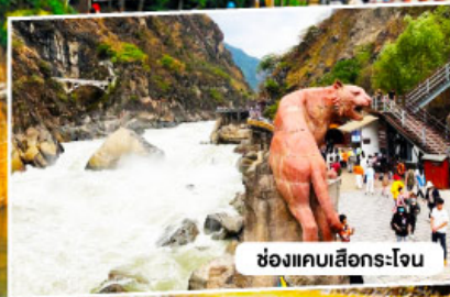
ช่องแคบลีเจียง