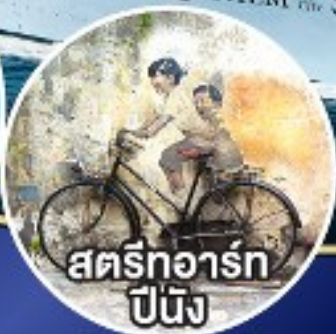
สตรีทอาร์ต ปีนัง