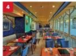
Hot Pot Enjoy your favourite noodles with an extensive list of beverages available to complement your dinner.