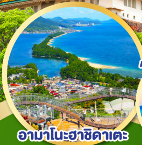
อามาโนะฮาซิดาเตะ