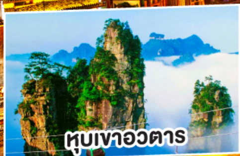
หุบเขาอวตาร