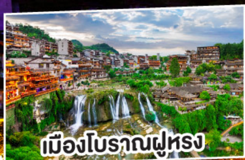
เมืองโบราณผู่หลง