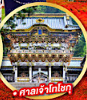
• ศาลเจ้าโทโชกุ