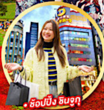
• ช้อปปิ้ง ชินจูกุ

กิจกรรมใส่ชุดกิโมโน พร้อมชมโชว์การแสดงต่างๆ