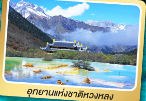
อุทยานแห่งชาติหลวงหลอง