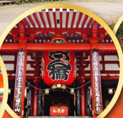
วัดอาซากุซะ