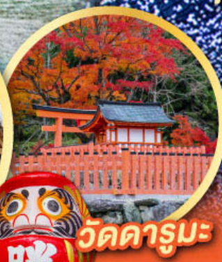
วัดคารุมะ