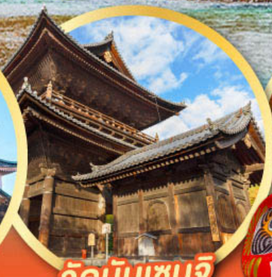
วัดนินเซนจิ