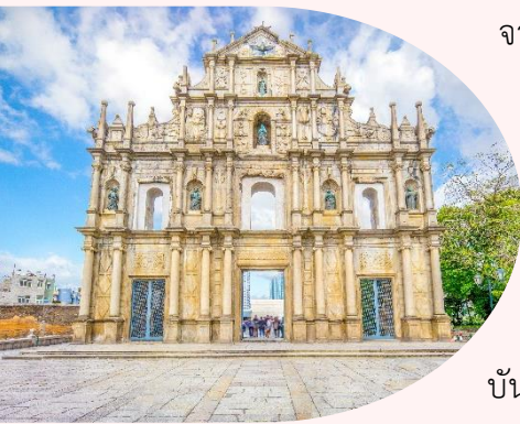
แห่งเดียวเท่านั้นในโลก

หมายเหตุ: เนื่องจาก เจ้าแม่กวนอิมริมทะเล อยู่ระหว่างการซ่อมบำรุง ตั้งแต่ตอนนี้จนถึงเดือน เมษายน 2567 กรุณ ัณ วันที่เดินทางยังซ่อมบำรุงไม่เรียบร้อย ทางบริษัทของสงวนสิทธิ์ ในการนำท่านเดินทางสู่ ไทปาสตริทฟู้ด ถนนที่เต็มไปด้วยร้านอาหาร ขนม ของอร่อยเมืองมาเก๊า ทดแทน