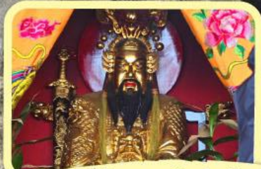
• เอียงบู๊ซัว (ศาลเจ้าพ่อเสือ)