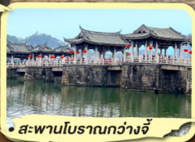
• สะพานโบราณกว้างจี้