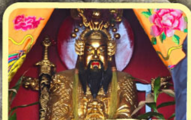
• เอียงบู๊ซัว (ศาลเจ้าพ่อเสือ)