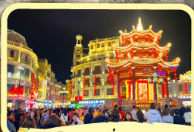
• ถนนโบราณเสี่ยวกงหยวน