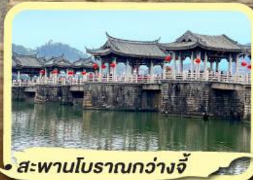
• สะพานโบราณกว่างจี