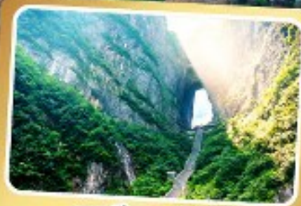
เขาคีเยนเหมินซาน

ทริปเดียวเที่ยว 2 เมืองโบราณ ฝูหลงและเฟิ่งหวง