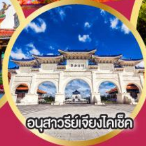
อนุสาวรีย์เจียงไคเช็ค