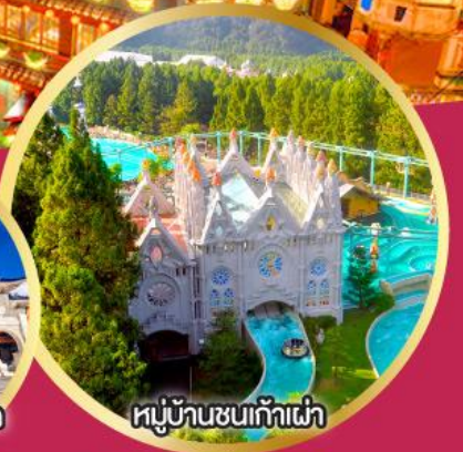
หมู่บ้านชนเก้าเผ่า