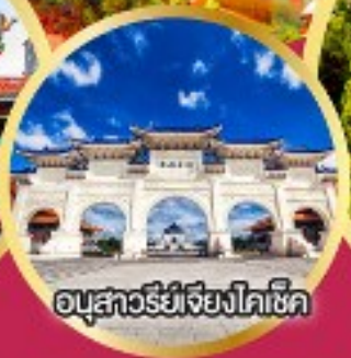
อนุสาวรีย์เจียงไคเช็ค