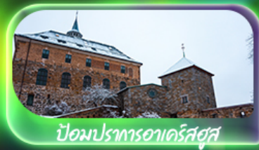
บิ๊อมปรอทอาร์ตส์ฮุส