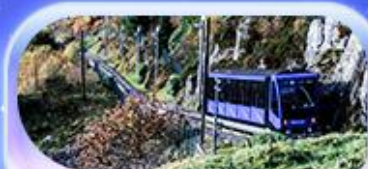
นั่งรถรางขึ้นยอดเขาฟลอยอน

เปิดประสบการณ์สุดจ้าว... สักครั้งในชีวิต! ล่องเรือชมฟยอร์ด