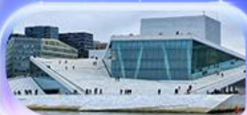
โอเปร่าเฮาส์

07-15 ต.ค.69 / 16-24 ต.ค.69 13-21 พ.ย. 69 / 04-12 ธ.ค. 69 25 ธ.ค. 69 - 02 ม.ค. 70 (ปีใหม่)