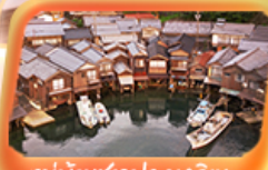
หมู่บ้านชาวประมงอิเะ