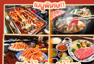
บุฟเฟ่ต์ญี่ปุ่น สเต็ก Kobe