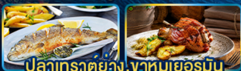
ปลาเทราต์ย่าง, จานหมูเยอรมัน