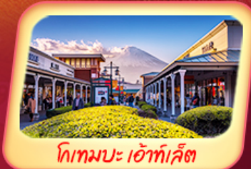
โทกามะ: เอ้าท์เล็ต

เปิดวาร์ปสะกดทุกสายตาคมวิวาโนรามานของภูเขาไฟฟูจิ ขึ้นกระเช้าลอยฟ้าฮาโกเนะ โคมะกาตาตะ ปักหมุดสวนโออิชิ ไหว้พระขอพรเสริมดวงที่ประตูสายมู "โคมไฟยักษ์สีแดง" วัดอาซากุสะ ปิดท้ายความบันเทิงที่ล้ำสมัยช้อปปิ้งจุใจ ย่านชินจูกุ และ โทกามะ: เอ้าท์เล็ต