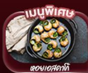
เมนูพิเศษ

ชมหอไอเฟล ล่องเรือชมวิวปารีสสองฝั่งแม่น้ำแซน ประดูชัยอันยิ่งใหญ่ เยือนพระราชวังแวร์ซายส์ อลังการด้วยสถาปัตยกรรมและสวนอันกว้างใหญ่ พิพิธภัณฑ์ลูฟร์ ช้อปปิ้งที่ถนนชองเซลีเซ่ อีสรระเต็มวันสัมผัสบรรยากาศปารีส