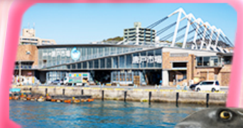
KARATO FISH MARKET