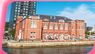
โมจิโกะ เรโทร