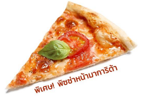
พิเศษ! พิซซ่าหน้ามาการิตต้า

เที่ยง ๑๑ รับประทานอาหารกลางวัน (มื้อที่1) เมนูพิเศษ!! พิซซ่าหน้ามาการิตต้า นำท่านเดินทางสู่ เมืองโคโม (Como) (ระยะทาง 51 กม. / 45 นาที) ตั้งอยู่บริเวณพรมแดนกับประเทศสวิตเซอร์แลนด์ โคโมเป็นเมืองที่ตั้งอยู่ในเทือกเขาแอลป์ พาทุกท่านไปเก็บภาพความประทับใจกับ ทะเลสาบโคโม (Lake Como) ขึ้นชื่อว่าเป็นทะเลสาบที่สวยงามที่สุดในโลก มีรูปร่างลักษณะเฉพาะของทะเลสาบโคโมทำให้นึกถึง Y ที่กลับด้านที่โด่งดังไปทั่วโลก เป็นผลมาจากการละลายของธารน้ำแข็งรวมกับการกัดเซาะของแม่น้ำ Adda โบราณ ทำให้เกิดทางแยกเป็นตัว Y และยังเป็นทะเลสาบมีทิวทัศน์ที่งดงามที่สุดแห่งหนึ่งในโลก