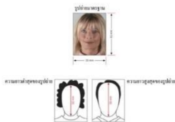
รูปถ่ายมาตรฐาน