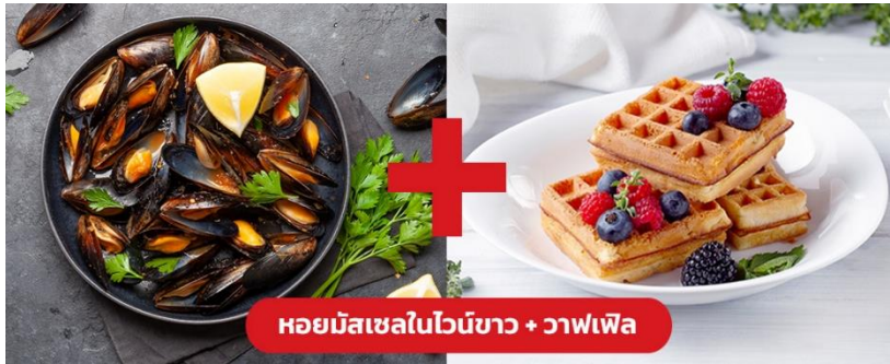
หอยมัสเซลในไวน์ขาว + วาฟเฟิล

๑๐ | รับประทานอาหารกลางวัน (เมื่อที่ 10) เมนูพิเศษ!! หอยมัสเซล + วาฟเฟิล (Mussel in White wine + Waffle)