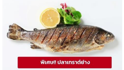
พิเศษ!! ปลาเทราต์ย่าง

เที่ยง ๑๐ รับประทานอาหารเที่ยง (มื้อที่6) เมนูพิเศษ ปลาเทราต์ย่างท่านละ 1 ตัว นำท่านเดินทางสู่ เมืองมรดกโลกเชคที่ ครุมลอฟ (Cesky Krumlov) สาธารณรัฐเช็ก (ระยะทาง 210 กม./ 3.30 ชม.) ล้อมรอบด้วยแม่น้ำ Vltava ทำให้เมืองแห่งนี้มีลักษณะคล้ายหยดน้ำ จนถูกขนานนามว่าเป็น "เมืองหยดน้ำ" จากนั้นนำท่านถ่ายรูปบริเวณรอบนอก ปราสาทครุมลอฟ (Cesky Krumlov Castle) เป็นปราสาทกอธิคดั้งเดิม ตั้งอยู่ริมฝั่งแม่น้ำวัลตาวาบนแหลมหิน มีหอคอยสีชมพูหวานๆ ราวกับปราสาทเจ้าหญิงในนิยาย มีอายุกว่า 700 ปี เคยเป็นคฤหาสน์ส่วนตัวของขุนนางถึง 3 ตระกูล ก่อนจะตกเป็นสมบัติของรัฐบาล