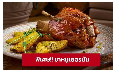
พิเศษ!! ขาหมูเยอรมัน

ที่พัก : Hotel Goldenes Schiff หรือโรงแรมระดับใกล้เคียงกัน (ชื่อโรงแรมที่ท่านพัก ทางบริษัทจะทำการแจ้งพร้อมใบนัดหมาย 5-7 วัน ก่อนวันเดินทาง)