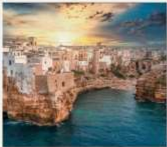
POLIGNANO A MARE

อิตาลีตอนใต้มีเสน่ห์ดึงดูดใจอย่างยิ่ง เป็นดินแดนโรแมนติกแห่งปราสาท โบสถ์ และซากปรักหักพังแบบคลาสสิก ไม่ว่าจะเป็นวิลล่าโพลิญาโน อา มาเร่ ร้านอาหารสุดหรูในถ้ำ GROTTA PALAZZESE พระราชวังในโพซิตาโน อ่าวเนเปิลส์มีเสน่ห์ดึงดูดใจอย่างเหลือเชื่อ ตั้งแต่เกาะคาปรีที่สวยงามตระการตาไปจนถึงภูเขาไฟที่สงบนิ่ง และแหล่งโบราณคดีระดับโลกไปจนถึงชายฝั่งอามาลฟีที่คดเคี้ยว แคว้น “ปูลยา” เป็นที่รู้จักกันดี ด้วยสถาปัตยกรรมแบบโรมานเนสก์และบาโรก ปราสาทของนักรบครูเสด และบ้านทรงกรวยคล้ายรังผึ้งที่เรียกว่ากูรูลี เป็นจุดหมายปลายทางที่กำลังมาแรง