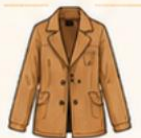
เสื้อแจ็กเก็ต หรือโค้ทตัวยาว