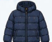
เสื้อขนเป็ด