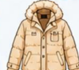
เสื้อโค้ทกันหนาว ตัวหนา