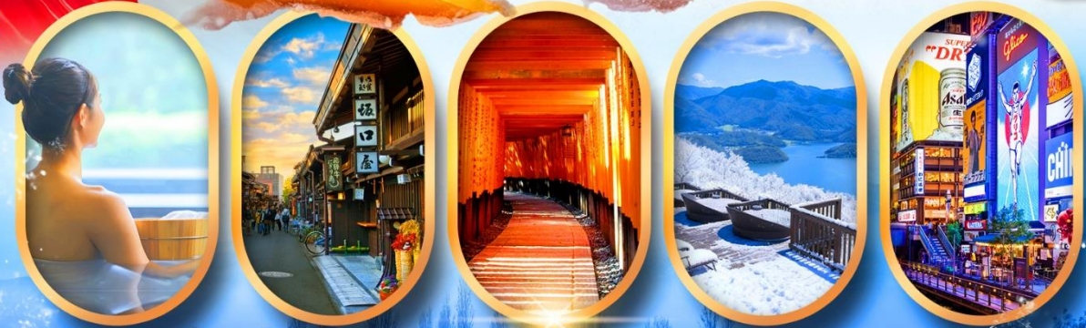
พักโรงแรมออนเซ็น เมืองเก่าทาคายาม่า ศาลเจ้าจิงจอก ทะเลสาบมิดะตะ ย่านชินโซบาชิ