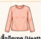
สวมเสื้อฮีทเทค (Heattech) ไว้ด้านในเพื่อเพิ่มความอบอุ่น แทนการใส่เสื้อหนาๆ หลายชั้น