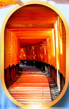
ศาลเจ้าจิงจอก