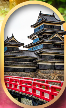
ปราสาทคามาโมโตะ