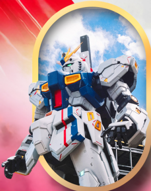
ห้างลาลาพอกันดั้ม