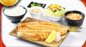
เมนูพิเศษ Set ปลาซอกเกะ