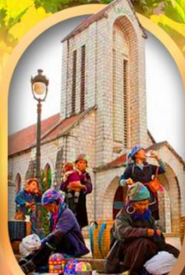
โบสถ์หินซาปา