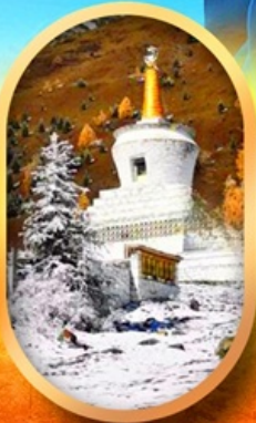
อุทยานสี่ครุณี