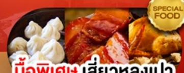
มือพิเศษ เสี้ยวหลงเปา หมูตงพอ ไก่จอกาน เดินทาง ม.ค. - มี.ย. 69