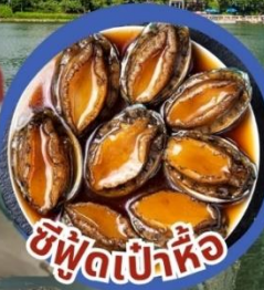
ซีฟู้ดเป่าหื้อ