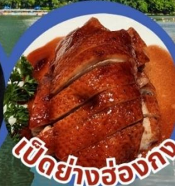
เป็ดย่างฮ่องกง