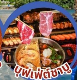
บุฟเฟ่ต์ชาบู