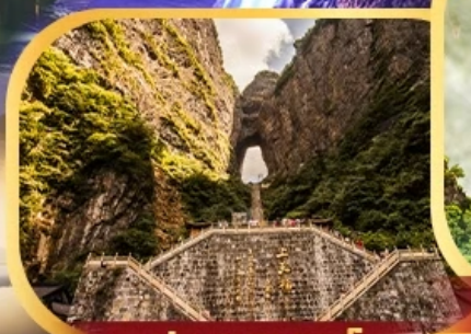
ประตูสวรรค์