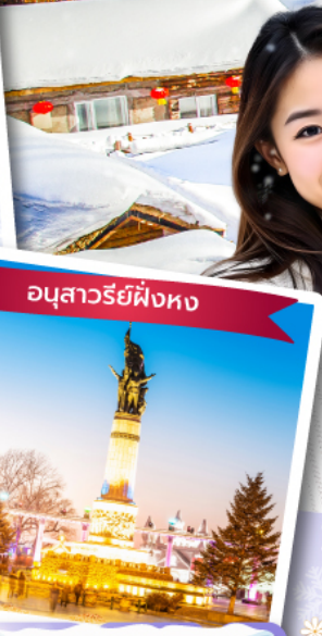
อนุสาวรีย์ผึ้งหง