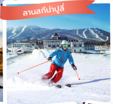
ลานสกีน้ำปู๋ลี่