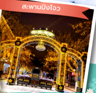
สะพานปิงโหว