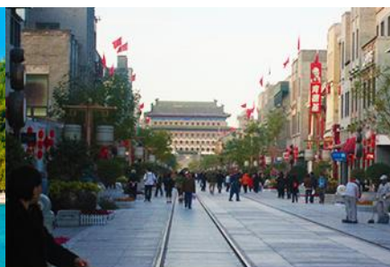
ถนนเฉียนเหมิน