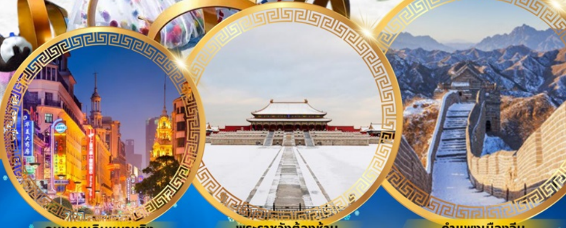
ถนนคนเดินหนานจิง