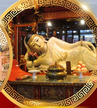
วัดพระหยกขาว