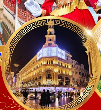
ถนนคนเดินหนานจิง

เดอะบอนด์ หาดไต้หวัน ขึ้นหอไข่มุก อิสระ เชียงใหม่ ดิสนีย์แลนด์ วัดหลงหัว อายุมากกว่า 1700 ปี สักการะวัดพระหยกขาว สวนอีหวนกว่า 400 ปี สตาร์บัค ใหญ่ที่สุดในเอเชีย ช้อปปิ้งถนนโบราณชื่อดัง