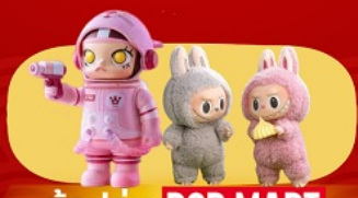
ช้อปปิ้ง POP MART