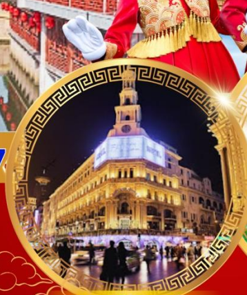
ถนนคนเดินหนานจิง

เดอะบอนด์ หาดไว่กาน ขึ้นหอไข่มุก อิสระ เชียงใหม่ ดิสนีย์แลนด์ วัดหลงหัว อายุมากกว่า 1700 ปี สักการะวัดพระหยกขาว สวนอี๋หยวนกว่า 400 ปี สตาร์บัค ใหญ่ที่สุดในเอเชีย ช้อปปิ้งถนนโบราณชื่อดัง