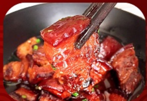
พิเศษ!! หมูสามชั้นน้ำแดง