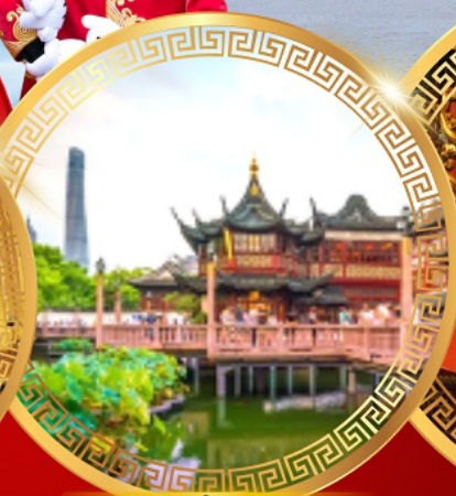
สวนอีหวน