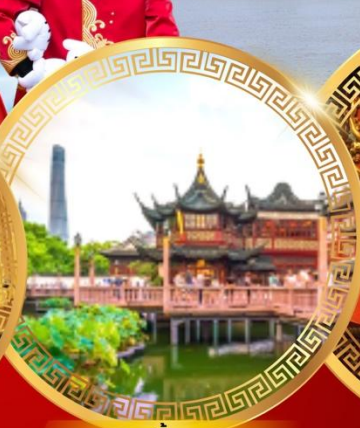
สวนอี๋หยวน