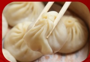
พิเศษ!! เสี่ยวหลงเป่า