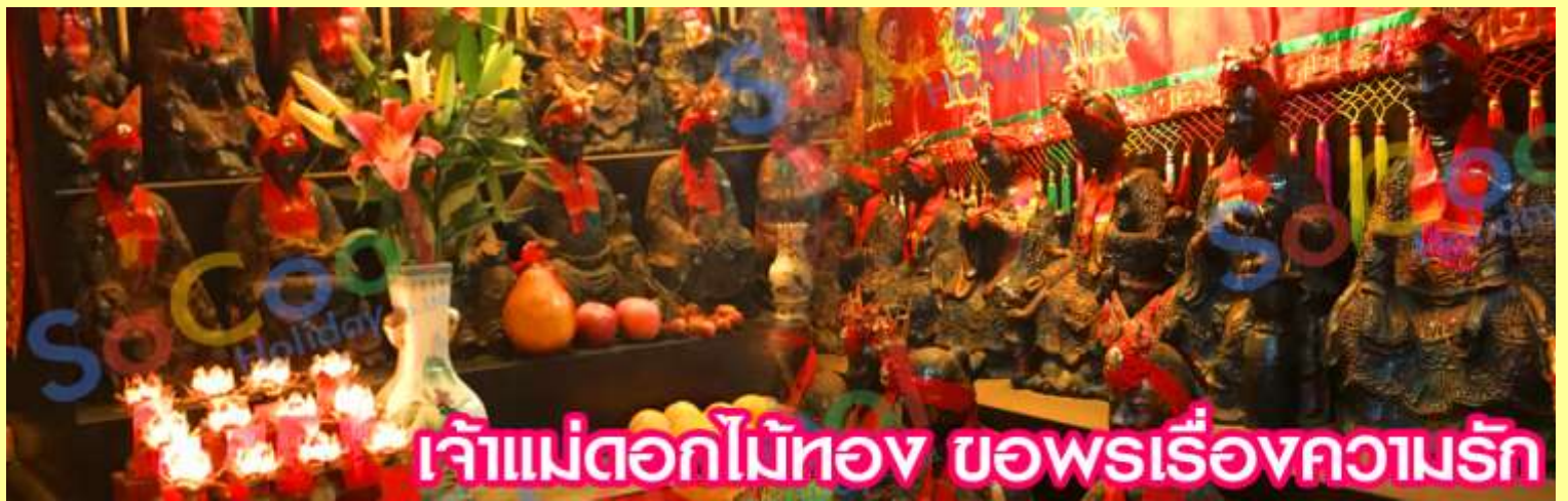
เจ้าแม่ดอกไม้ทอง ขอพรเรื่องความรัก