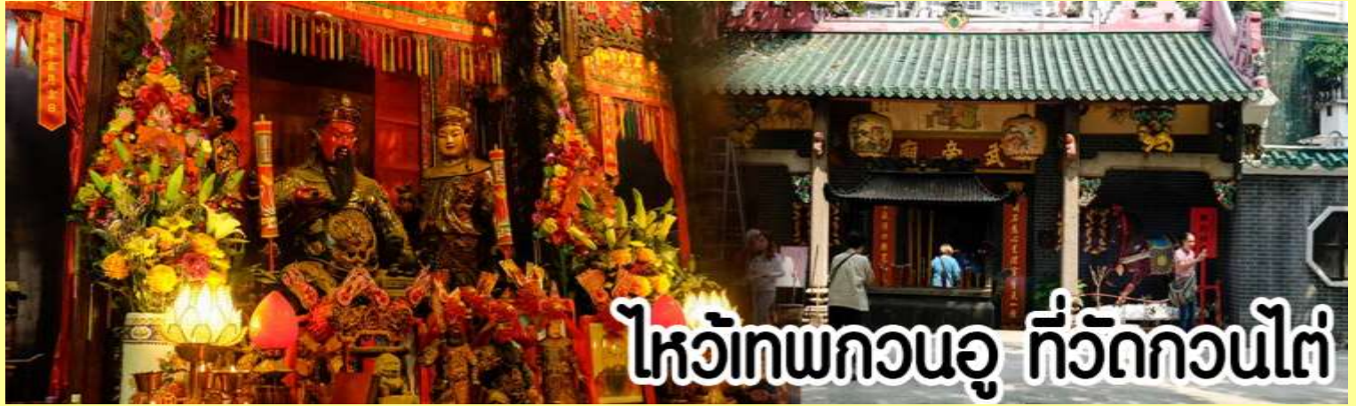
ไหว้เทพกวนอู ที่วัดกวนไต่

หลังจากนั้นขอพรเทพเจ้ากวนอู ณ วัดกวนไต่ วัดเก่าแก่สร้างขึ้นในปีพ.ศ. 2434 เป็นวัดเดียวในเกาลูนที่บูชาเทพ เจ้ากวนอูเป็นเทพผู้ยิ่งใหญ่ เทพเจ้าแห่งความซื่อสัตย์ โชคลาภ บารมี